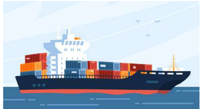
Illustration by Dhitya Putra Ramadhan

Pada tahapan ini pemilik kapal akan mensubmisi EEXI document technical file, dimana berisi informasi tentang dimensi kapal, daya main engine, daya aux. engine, konsumsi bahan bakar (SFOC) main engine, dan aux. engine, sea trial report/ model test report jika ada. Jika saat tahap pre calculation EEXI tidak terpenuhi maka tahapan selanjutnya adalah dengan menggunakan Engine Power Limitations (EPL).